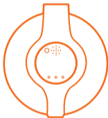
1x Automatic Medication Dispenser